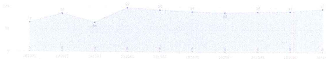
Total de vínculos, efetivos e temporários

Reiteramos que estas informações são imprescindíveis para fins de fiscalização por parte deste Tribunal no tocante ao cumprimento do previsto na Meta 18 do PNE.